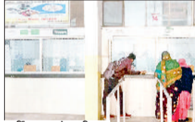
पर्ची कटवाते मरीज।