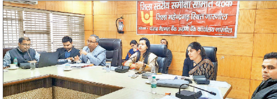
नारनौल। अधिकारियों की बैठक लेती डीसी मोनिका गुप्ता।

कागजात तैयार नहीं कर सकते। ऐसे में अधिकारी उनके कागजात पूरे करवाने में सहयोग करें। इस मामले में संबंधित विभाग भी उनकी मदद करेंगे। अगर फील्ड में किसी भी तरह की जरूरत है तो भी विभाग तैयार रहेगा। उन्होंने निर्देश दिए कि बैंक की ओर से स्वीकृति पत्र ऑनलाइन