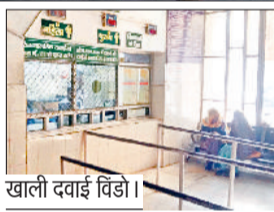
खाली दवाई विंडो।

हरियाणा सिविल मेडिकल सर्विसिज एसोसिएशन की मुख्य मांग एसएमओ की सीधी पर भर्ती रोक लगाना है। इसके अलावा चिकित्सकों ने मांग की कि स्पेशलिस्ट कैडर का गठन किया जाए, ताकि मरीजों को बेहतर सुविधा मिल सके। एसपी केन्द्र सरकार की तर्ज पर चार, नौ, 13 व 20 साल पर दिया जाए, जो अभी पांच, 10 व 15 साल पर मिलता है।