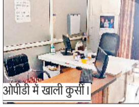
ओपीडी में खाली कुर्सी।

इन सर्विस कैंडिडेट जो पीजी कोर्स करने जाते हैं, उनसे एक करोड़ के बांड को घटाकर 50 लाख रुपये किया जाए आदि मांगें शामिल हैं।