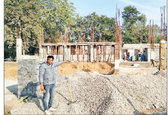
मंडी अटेली। पीजी कॉलेज के प्रशासनिक भवन के निर्माण कार्य में लगे हुए व पीजी कॉलेज का तोड़ा गया पुराना भवन।

कॉलेज के अधिकार कम्परे तोड़े, 42 साल पहले शुरू हुई थी कक्षाएं, 1996 में हुआ था सरकारी करण