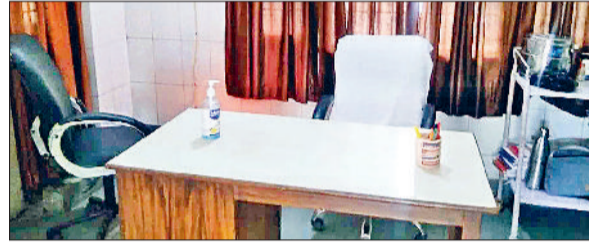
महेंद्रगढ़। नागरिक अस्पताल में खाली पड़ी चिकित्सक की कुर्सी।

इन सर्विस कैंडिडेट जो पीजी कोर्स करने जाते हैं, उनसे एक करोड़ के बांड को घटाकर 50 लाख रुपये किया जाए आदि मांगें शामिल हैं।