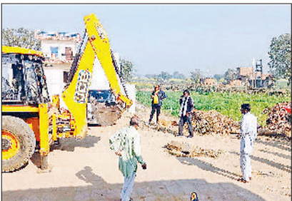
नारनौल। महरमपुर से जाखनी सड़क निर्माण कार्य करती जेसीबी मशीन व लड्डू बांटेकर डिटी सीएम का आभार जताते ग्रामीण।

जब सात मई को गांव गहली में जजपा जिला प्रवक्ता सिक्ंदर गहली की अगुवाई में जन सम्मान रैली हुई तो वहां आए उप मुख्यमंत्री दुष्यंत चौटाला के समक्ष महरमपुर से जाखनी सड़क निर्माण की मांग रखी थी। रैली के एक पखवाड़े बाद ही चंडीगढ़ से मंजूरी मिली। अब टेंडर अलार्ट होकर बुधवार सड़क निर्माण कार्य शुरू कर दिया गया। इस पर वहां के ग्रामीणों ने एकत्रित होकर लड्डू बांटेकर डिटी सीएम दुष्यंत चौटाला व प्रवक्ता सिक्ंदर गहली का आभार जताया है।