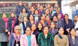
महेंद्रगढ़। बैठक करने के बाद उपस्थित स्टाफ सदस्य।