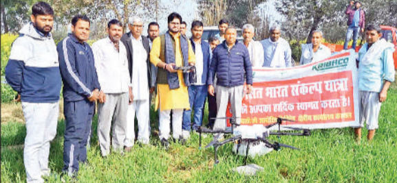
महेंद्रगढ़। ड्रोन के माध्यम से यूरिया खाद का छिड़काव करते हुए।