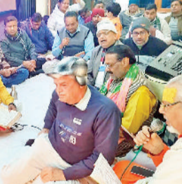
नारनौल। सुंदरकांड पाठ करते श्रद्धालु।